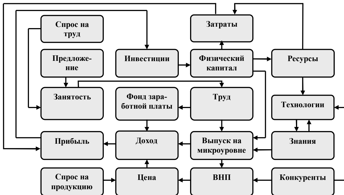
Рис. 2. Эволюционная модель экономического роста

Правила принятия решения управляют поиском. Рыночная конъюнктура воздействует на поиск путей влияния на решение предприятия о том, заниматься ли ему поиском (например, в области технологий или знаний, которые станут известными). Результат поиска определяется в терминах вероятностного распределения определенных знаний, которые будут найдены в процессе поиска. В состоянии поиска находятся также предприятия-конкуренты, которые стремятся занять определенный сегмент рынка.