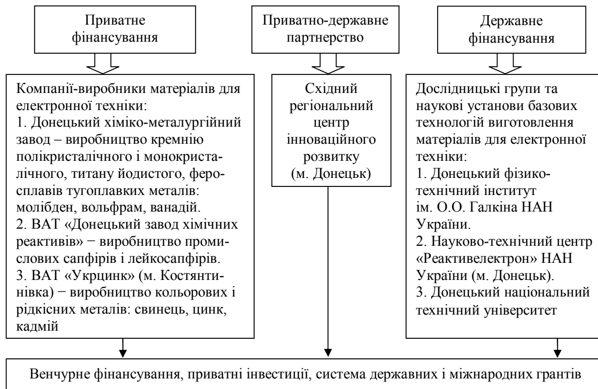
Рис. 2. Структура фінансування кластера «Матеріали для електроніки»

здійснюється моніторинг потенційних замовлень і розповсюдження цих даних серед компаній кластера;